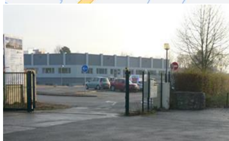
Parking gratuit face à la crèche