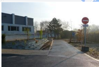
Empruntez l'accès piéton