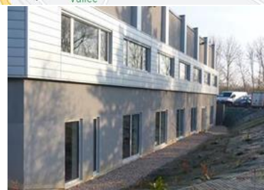
Bureaux situés en rez-de-jardin (sous la crèche)

URIOPSS Hauts-de-France • www.uriopss-hdf.fr • contact@uriopss-hdf.fr